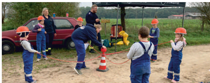
Auch die Feuerwehr-Zwergel waren schon mit Eifer beim Orientierungsmarsch dabei

Bereits im vergangenen Jahr hatten wir uns nach zwei Jahren erneut um die Ehrenschleife der Jugendfeuerwehr des Landkreises Ludwigslust-Parchim beworben. Eine Abnahme konnte Corona bedingt nicht stattfinden. Diese haben wir in diesem Jahr nachgeholt und mit Bravour bestanden. Wir waren die einzige Jugendfeuerwehr im Landkreis, die sich dieser Prüfung gestellt hat. Auf dem Jugendfeuerwehrtag des Kreises LUP in Parchim am 15. Oktober wurde uns die Ehrenschleife überreicht. Das war ein ganz besonderer Höhepunkt, denn Corona war auch an uns nicht vorbeigegangen. Plötzlich keine Ausbildungsdienste, keine Treffen in den Gruppen, keine Wettkämpfe, keine Zeltlager, keine Fahrten mehr. Die Arbeit der Jugendfeuerwehr war, mit einer kurzen Unterbrechung im Herbst 2020, komplett auf Eis gelegt.